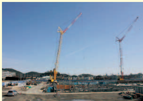
免震装置を設置する工事が行われています(2月中旬)